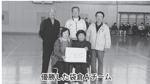
優勝した袋倉Aチーム